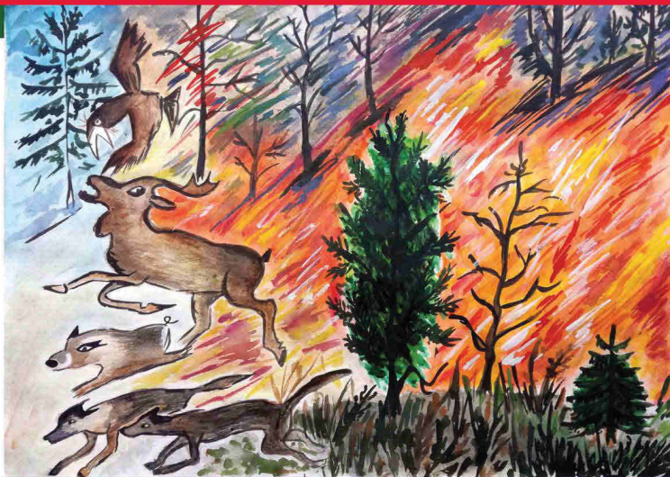
Автор: Иванина Колева – ШИИ "Живопис", гр. Казанлък Международен конкурс за детска рисунка, "С очите си видях бедата"

Пазете дрехите си от запалване, особено ако са от изкуствена материя. Ако се запалят, легнете на земята и се търкаляйте.